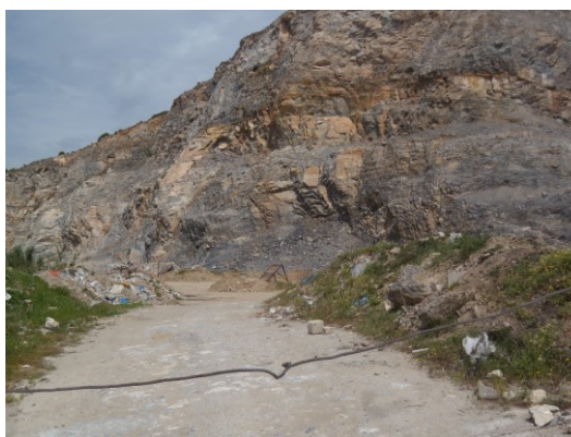
Φωτο 7 και 8: Ο χώρος των παλιών λατομείων, της πρώην κοινότητας Μακρινίτσας

Ο προϋπολογισμός της κατεδάφισης και της μεταφοράς των μπαζών υπολογίζεται στα 5.000.000 €, περίπου και της αποκατάστασης των λατομείων στο 1.000.000 €, περίπου.