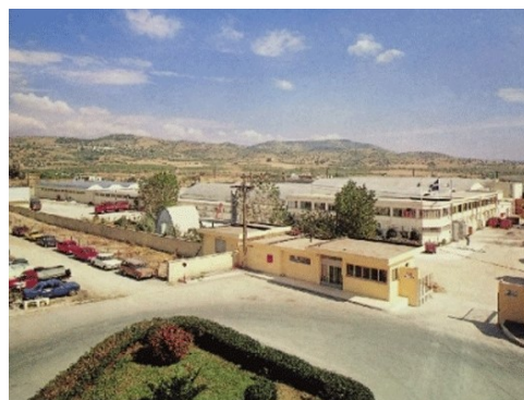
Φωτο 2 και 3: Τα προς κατεδάφιση κτίρια της Βαμβαουργίας, στη Νέα Ιωνία

Η κατεδάφιση των κτισμάτων, θα γίνει με μηχανικά μέσα και υπολογίζεται ότι τα προϊόντα αυτής θα είναι 40.000 – 50.000 κ.μ., περίπου. Με το δεδομένο ότι στη Μαγνησία δεν υπάρχουν οργανωμένοι και περιβαλλοντικά αδειοδοτημένοι χώροι απόθεσης αδρανών, προϊόντων από εκσκαφές και κατεδαφίσεις, οι εναλλακτικοί χώροι που θα μπορούσαν να