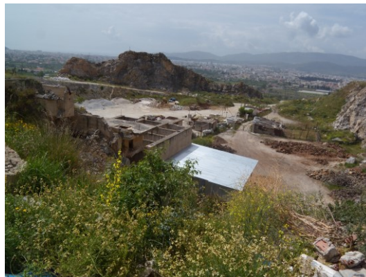
Φωτο 4 και 5: Ο χώρος των παλιών λατομείων, της πρώην κοινότητας Μακρινίτσας

Ως επικρατέστερη λύση, εμφανίζεται η περιοχή των παλαιών λατομείων στο Σαρακηνό, ιδιοκτησίας πρώην κοινότητας Μακρινίτσας, νυν Δήμου Βόλου (σχέδιο 2), καθώς στη δεύτερη περίπτωση πρόκειται για δημόσια δασική έκταση και απαιτείται παραχώρηση από την αρμόδια υπηρεσία του υπουργείου Αγροτικής Ανάπτυξης, ενώ η τρίτη περίπτωση, μπορεί να αποτελέσει εναλλακτική λύση της πρώτης, εφόσον υπάρξει σχετική αδειοδότηση από τον Δήμο Ρήγα Φεραίου.