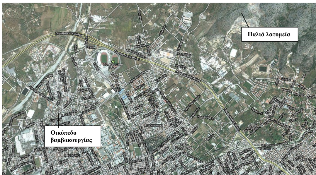
Φωτο 6 : Οι θέσεις του οικοπέδου της Βαμβακουργίας και των παλαιών λατομείων

Σήμερα, τα λατομεία αυτά έχουν γίνει χώροι παράνομης απόθεσης υλικών και τα προϊόντα της κατεδάφισης των κτιρίων αυτών, μπορούν αξιοποιηθούν για την αποκατάσταση έκτασης τουλάχιστον δέκα στρεμμάτων, έπειτα φυσικά και από τη σχετική περιβαλλοντική αδειοδότηση (φωτο 7,8).