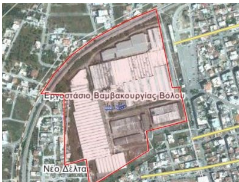
Φωτο 1: Το οικόπεδο της Βαμβακουργίας, στη Νέα Ιωνία

Η παρούσα πρόταση αφορά στο έργο της γενικής ανάπλασης του οικοπέδου, της πρώην κλωστοϋφαντουργίας «Βαμβακουργία Βόλου Α.Ε.», η οποία βρίσκεται επί των οδών Μυτιλήνης και Αγχιάλου, στον κεντρικό ιστό της Νέας Ιωνίας του Δήμου Βόλου και από το 2001, ανήκει στην ιδιοκτησία του Οργανισμού Εργατικής Κατοικίας (φωτο 1).